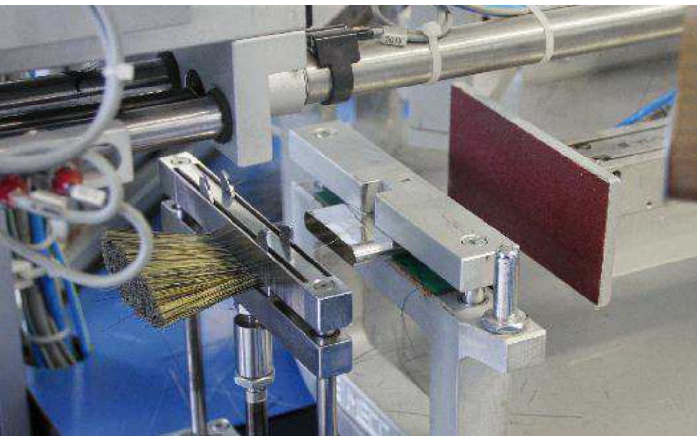
Maschinelles Einfüllen des Besatzmaterials in die Blechfassung.

Die Malerlernenden waren zwar interessiert, aber auch leicht amüsiert, als ihnen im Rahmen eines überbetrieblichen Kurses eine ökologische Reinigungsmaschine für Roller und Pinsel gezeigt wurde. Gefragt, was er von der Maschine halte, sagte einer: «Das ist schön und gut. Aber wir werfen unsere Malwerkzeuge weg, wenn wir eine Wohnung durchgestrichen haben.»