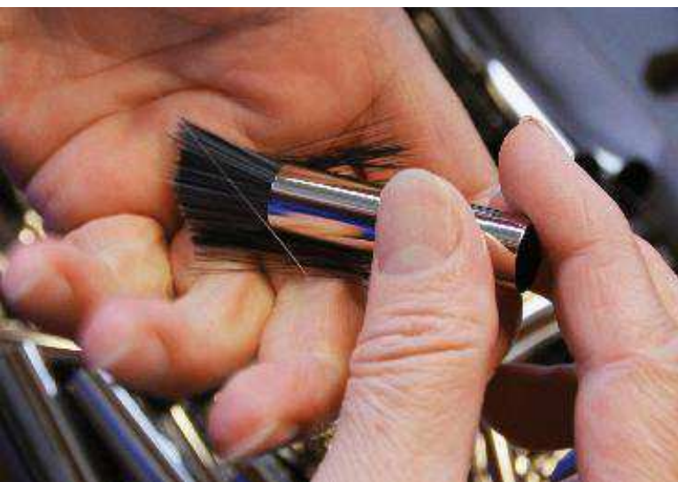
Das Befüllen der Fassung von Hand.

arbeiterin allenfalls noch immer absteigende Borsten wegschneidet. Der letzte Weg führt den Pinsel in den sogenannten Schrumpfkanal, wo der Kopf in eine Folie eingeschweisst wird, die für Schutz und Formstabilität bis zum Verkauf sorgt.