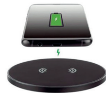
Wireless Charger 15W, schwarz, Ladepad für schnelles kabelloses Laden

Sie erhalten 10% Aktionsrabatt und zu jeder Box kostenlos einen Wireless Charger 15W