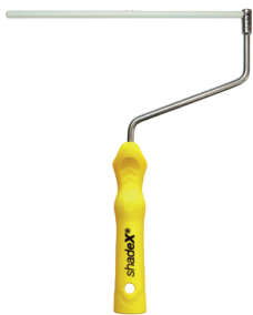
Rollerbügel shadeX Glasfaser Art. 1500-25

32 cm x 27 cm x 3,5 cm, Gewicht 205 g, rostfreier Edelstahl, Ø 8 mm